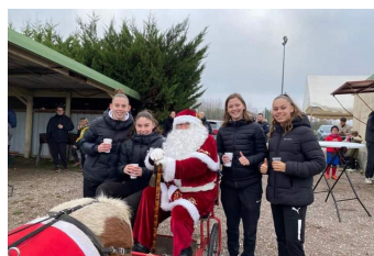
Le Père Noël sur son attelage avec des éducatrices

Cette année, nous lui avons donné rendez-vous le samedi 14 décembre 2024 en fin de matinée. Les dirigeants vous proposeront chocolat ou vin chaud ainsi qu'une tartiflette à emporter.