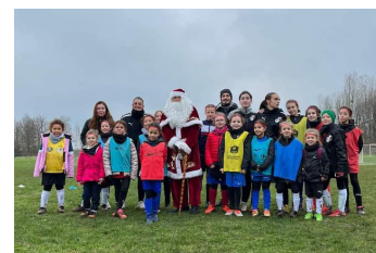
Le père Noël et nos petites